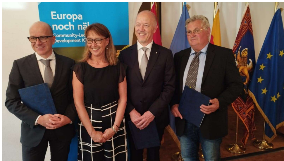
Hermagor, 15 giugno 2023